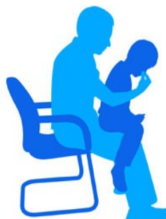
Child sits in adults lap