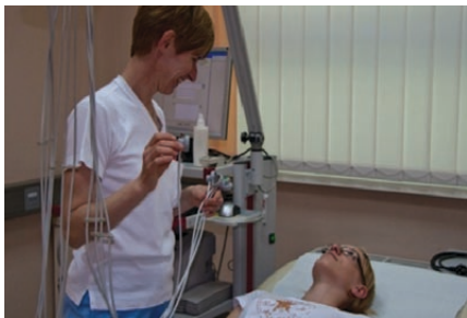
Pregled srca z elektrokardiografom (EKG)